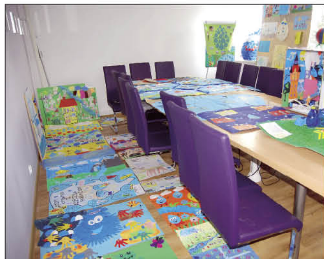
▲ Ilość prac przerosła nasze oczekiwania. Nie spodziewaliśmy się, że nasz pierwszy konkurs spotka się z takim zainteresowaniem.