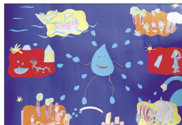
▲ Wyróżnienie: Przedszkole Słoneczna Szóstka w Śremie, Grupa „Żabki”