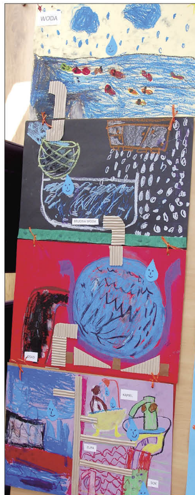
▲ I miejsce - Szkoła Podstawowa nr 1 w Śremie, Grupa „OB”

Był to pierwszy taki Konkurs organizowany przez Spółkę, ale na pewno nie ostatni. Konkurs ten wzbudził w nas dużo uśmiechu i entuzjazmu. W najbliższym czasie planujemy zorganizować Konkurs fotograficzny dla młodzieży z szkół średnich.